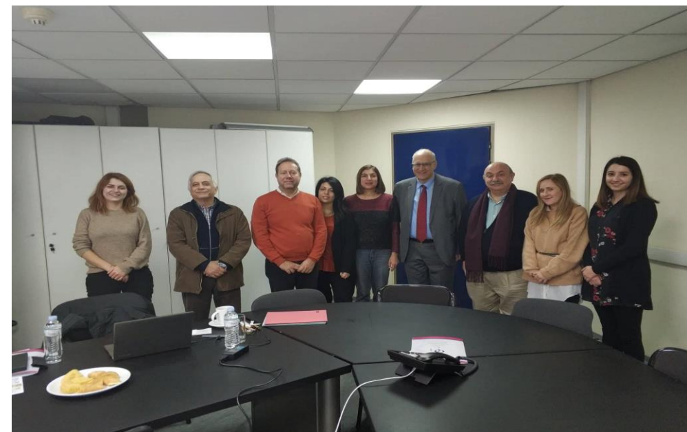
Photo de famille de la réunion de lancement

La réunion de lancement du projet s'est tenue dans les locaux de l'Université du Pirée, en Grèce, les 18 et 19 décembre 2018. Au cours de la réunion, les représentants des partenaires ont eu la possibilité de définir les objectifs pour les prochains mois, discuter et clarifier les tâches du projet et répartir le travail. Les partenaires se retrouveront les 21 et 22 mai 2019 à Rome, en Italie, où ils seront accueillis par UNIMED.