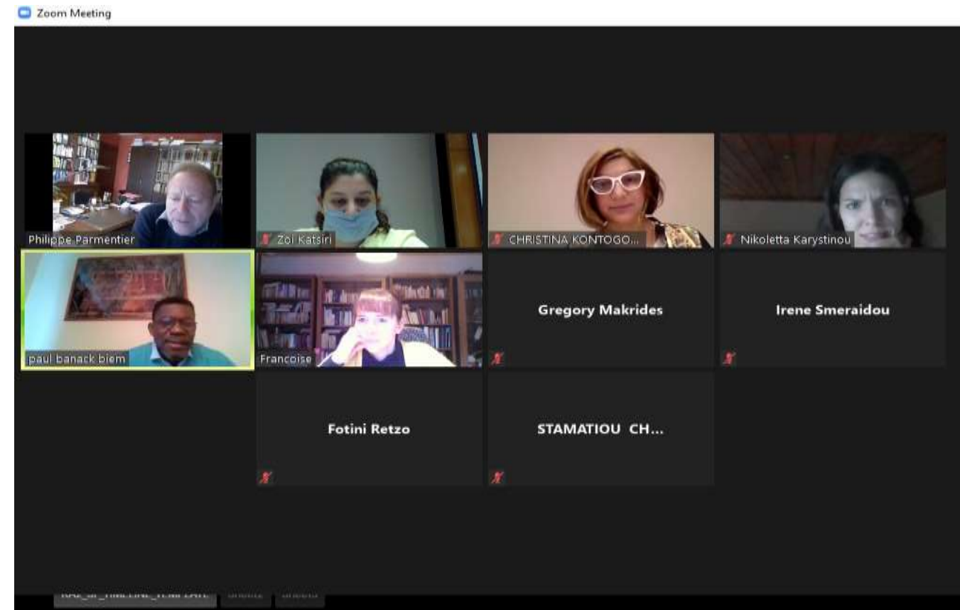
Foto dall'attività di Training online C1

Il Meeting Finale del Progetto si terrà a Cipro tra il 18 ed il 19 febbraio 2021.